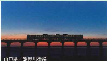
山口県 惣郷川橋梁