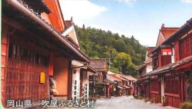
岡山県 吹屋ふるさと村