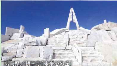
広島県 耕三寺「未来心の丘」